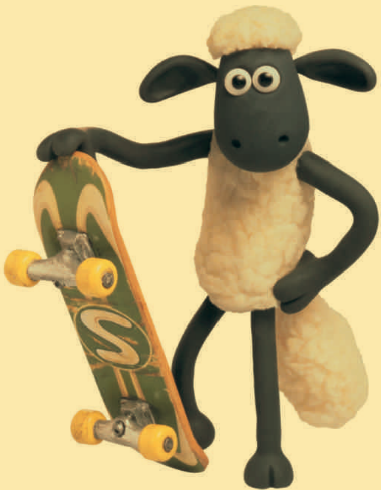
SHAUN LE MOUTON