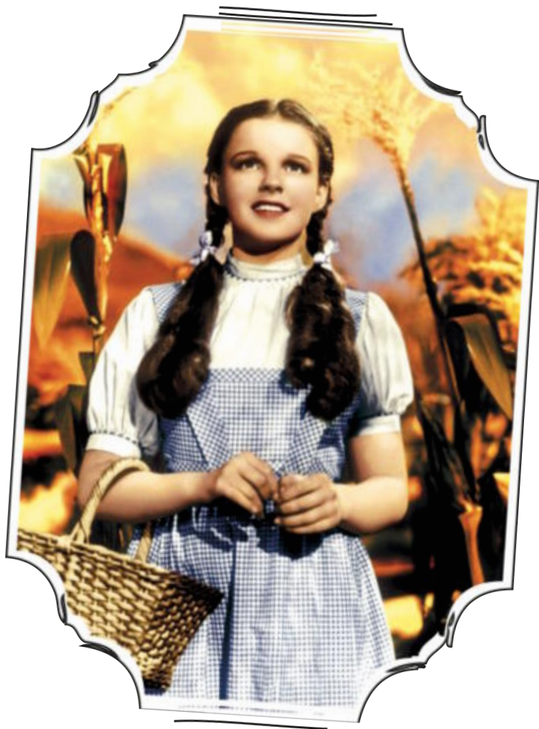
LE MAGICIEN D'OZ